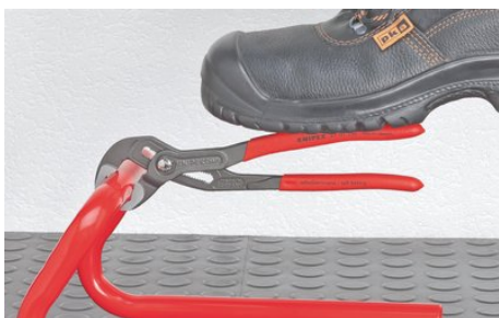
Zuby přesazené proti směru otáčení způsobují samosvorný efekt a zabraňují sklouznutí po obrobku.